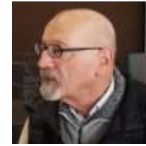
( https://civico20-news.it/author/piero-cartella/ )

Le Festival International Nature Namur aussi célèbre en 2024 un important anniversaire: 30 ans d'activité. Pour cette spéciale édition du FINN, le GPFF a proposé au public du festival un voyage au cœur des secrets du bouquetin, animal-symbole des Alpes, à travers l'exposition photographique "Le Grand Paradis et son Roi": une histoire d'équilibre entre l'homme et la nature et de salut mutuel dans le premier parc national d'Italie, en Vallée d'Aoste. Cette