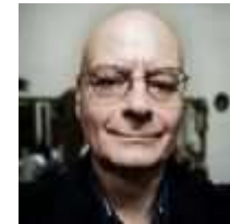
VITO PIEPOLI ( https://civico20-news.it/author/vito-piepoli/ )

Redattore Civico20News ( https://civico20-news.it/author/armeno-nardini/ )