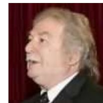
(https://civico20- news.it/author/massimo -calleri/)

MASSIMO CALLERI (https://civico20- news.it/author/m assimo-calleri/)