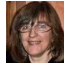
( https://civico20-news.it/author/maria-l-pronzato/ )

Redattore Civico20News ( https://civico20-news.it/author/gianfranco-piovano/ )